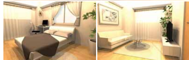
※室内写真はイメージとなりますので、実際と異なる場合がございます